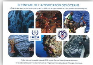
Brochures du Workshop 2015