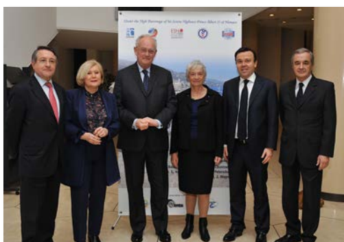
Membres du gouvernement et représentants du CSM lors de la cérémonie d'ouverture du WCBC V