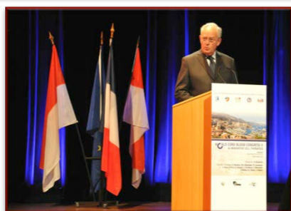
SEM Michel Roger, lors de l'inauguration du World Cord Blood Congress V